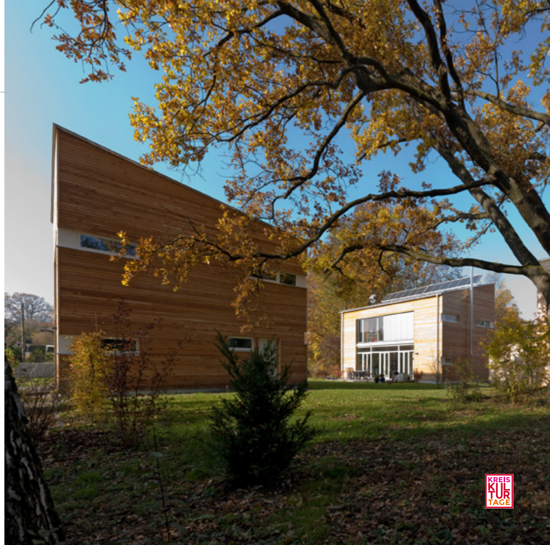
Abb. rechts: Gruppe Niedertemperaturhäuser in Diessen am Ammersee. Architekten: Atelier Lüps

Referent: Dr. Vinzenz Dufter, Architekt Bayerischer Landesverein für Heimatspflege e.V.