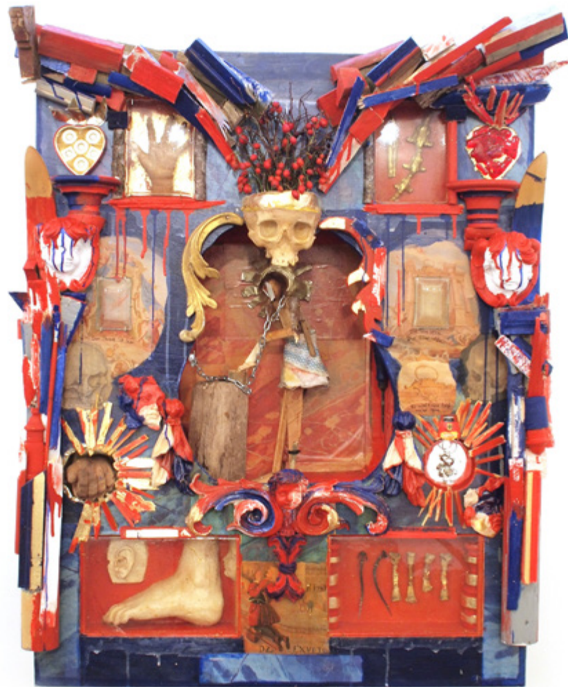
Abbildung: Assemblage-Skulptur „rokokopunkaltar“, 2016 Unter Mitarbeit von Ilka P. Claren und Rumjana Praxenthaler (Glasarbeiten) Maße: 125 x 80 x 39 cm.

Bamiyan ist ein Thema, das Praxenthaler sehr am Herzen liegt. 2001 wurden dort die berühmten Buddhas von den Taliban zerstört. Wenige Jahre später wurde Praxenthaler gefragt, an der Sicherstellung der Buddha-Reste mitzuwirken. Mittlerweile leitet der Bayer die Restaurierung der Buddhas und ist für das Unesco-Projekt jedes Jahr für einige Monate im afghanischen Hochland unterwegs.