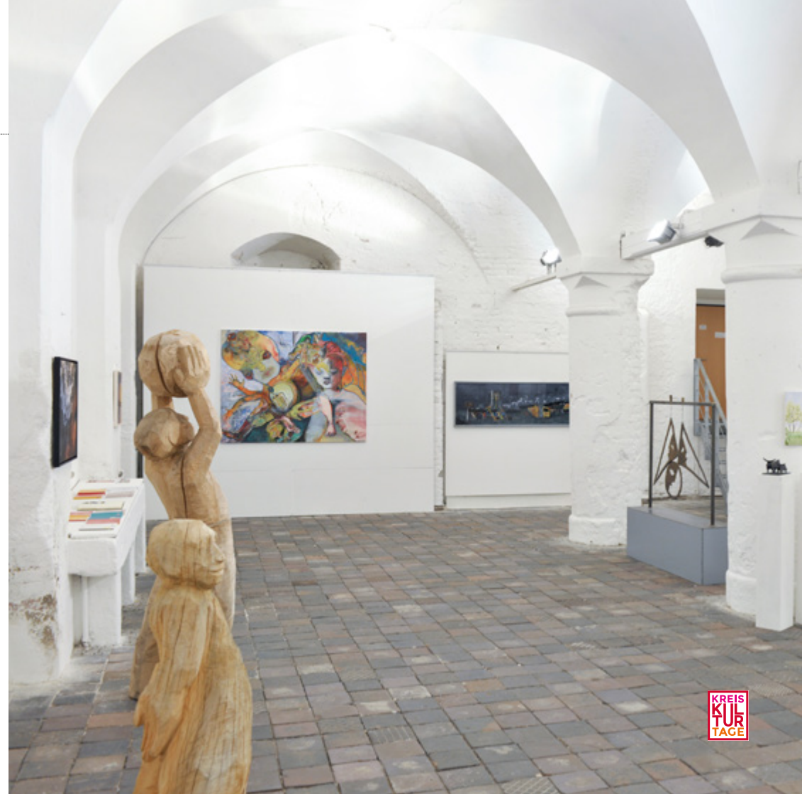
Abb. rechts Jahresausstellung in der Säulenhalle

Vernissage am Sonntag, 25.06.2017 um 15.00 Uhr